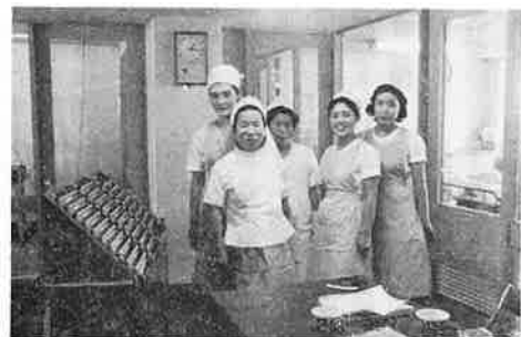
左より二番目筆者